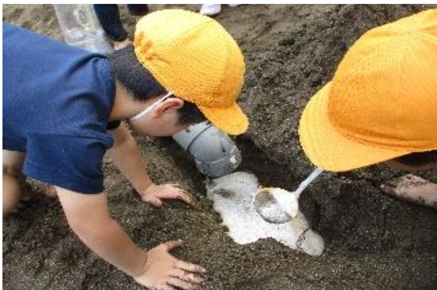
令和4・5年度 研究主題